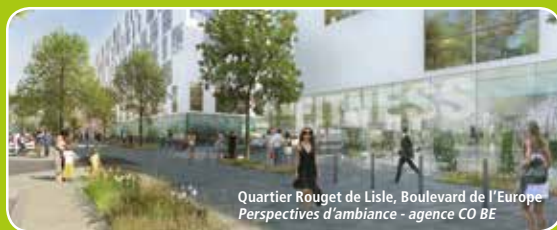
Quartier Rouget de Lisle, Boulevard de l'Europe Perspectives d'ambiance - agence CO BE

Ce tracé permettra également un accompagnement renforcé du développement urbain de Poissy, en desservant plusieurs projets urbains tels que le quartier Rouget de Lisle (ex ZAC EOLES) mais aussi des quartiers existants comme Saint-Exupéry.