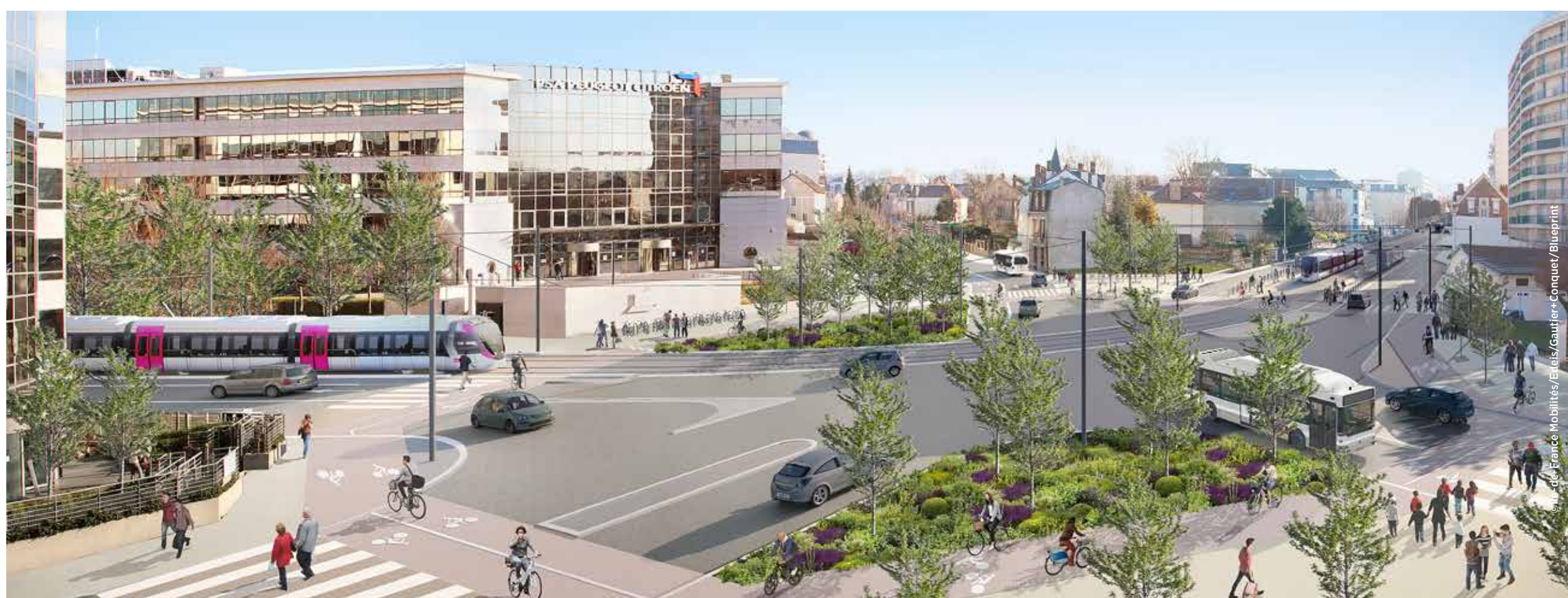
Place de l'Europe (Intention d'aménagement)